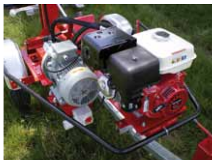
Combiné moteur thermique + électrique