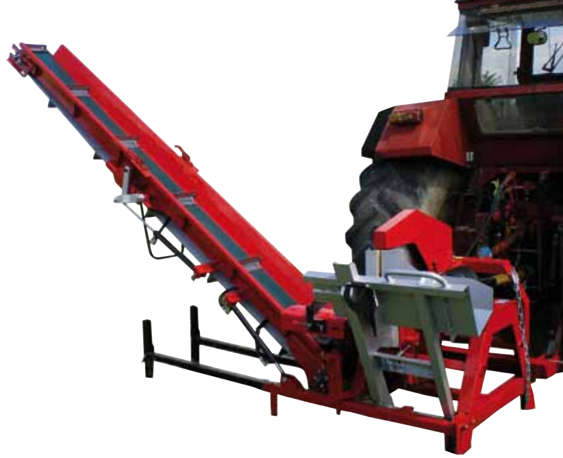
Position de travail, tapis déplié