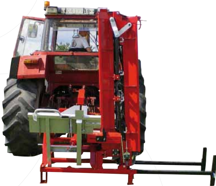
Position de transport, tapis replié