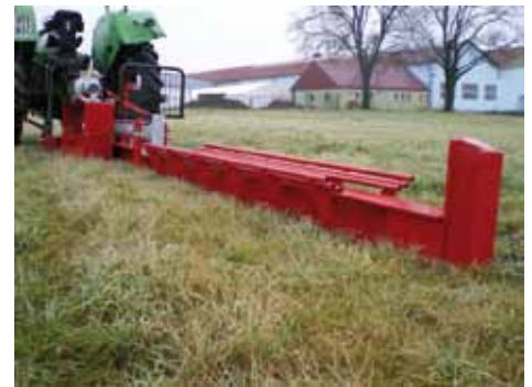
Fendeur 25 tonnes, ouverture 280 cm, course du vérin 180 cm, combiné prise de force + moteur électrique