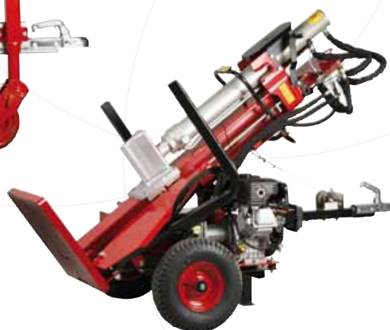
VMR-S non homologué pour la route Basculement mécanique de la machine