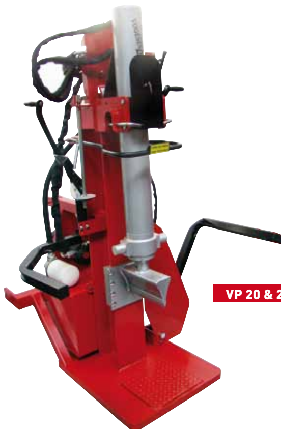
VP 20 & 25