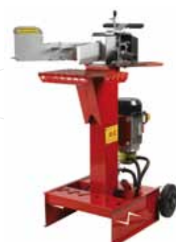
FB500/05 7 to.