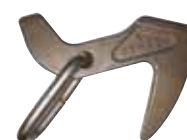
CROCHET À FRAPPER