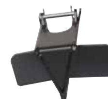
FENDEUR EN CROIX