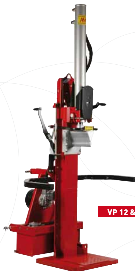
VP 12 & 16

Grace à sa forme, le couteau permet un meilleur rendement avec moins de puissance