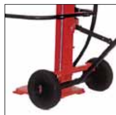
ROUES ET TIMON DE MANUTENTION