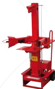
HOBBY 6 6 to.