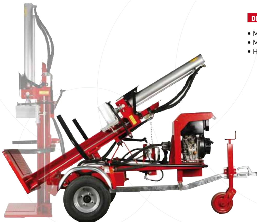
Essieu routier et basculement hydraulique