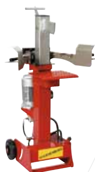
FB500/G4 6 to.